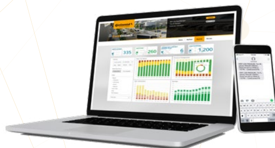
3 Portail Web et alertes mobiles