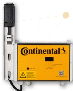
2 Lecteur de cour