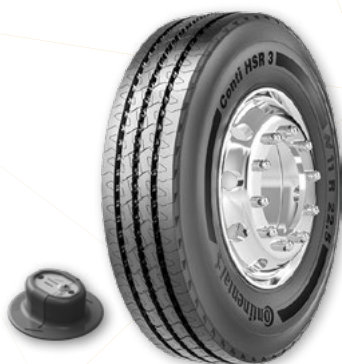
1 Capteur de pneu (un par roue utilisée)